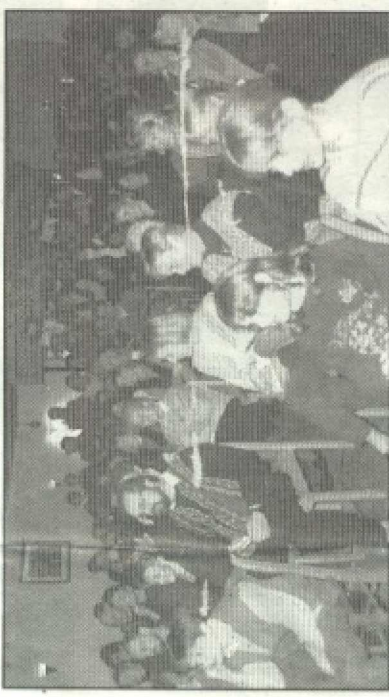
Nach lautstarkem Beifall ließen die 160 begeistertesten Zuhörer den Chor erst nach zwei Zugaben von der Bühne.

animierten die jazzigen Gospellieder wiederum zum Singen und Swingen. Zahlreiche Soli einzelner Sängerrinnen – auch einzeln sehr überzeugend klingen.